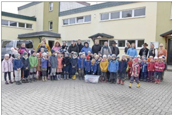
Die Kinder und pädagogischen Fachkräfte zusammen mit Vertretern des Clubs sowie der Leitung.