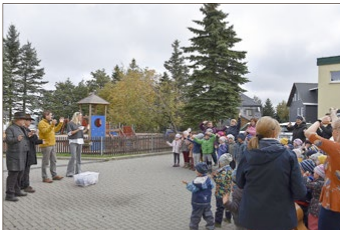
Die Kinder der Seepferdchen, Seesterne, Schmetterlinge und Bienen bedankten sich mit herbstlichen Liedern und einem schwungvollen Tanz.

Da staunten die Kinder des AWO integrativen Kindergartens „Tausendfüßler“ nicht schlecht, als plötzlich zwei Cowboys bei ihnen im Kindergarten auftauchten. Im Gepäck hatten sie eine großzügige finanzielle Spende für die Kinder der Kindergärten „Tausendfüßler“, dem „Haus der kleinen Strolche“ und dem „Kinderland am Apelsberg“. Im September waren die Kinder der Stadt Neuhaus am Rennweg mit ihren Familien herzlich auf die Crazy Ranch eingeladen. Die Einnahmen dieses Festes sollen nun den 222 Kindern der drei Kindergärten zugutekommen. Dafür bedanken sich die drei Neuhäuser Kindergärten von Herzen. Auch mitgebrachte Süßigkeiten und Spielsachen fanden bei den Kindern reißenden Absatz. Natürlich haben die „Tausendfüßler“-Kinder schon die ersten Ideen, was sie sich mit dem Geld gerne kaufen würden: Auf der Wunschliste ganz oben stehen neue Holzpferde für den Spielplatz, um auf deren Rücken auch einmal ein richtiger Cowboy zu sein. Zusammen mit allen Kindern werden aber noch weitere Ideen gesucht und wir sind gespannt für was sie sich letztendlich entscheiden werden.